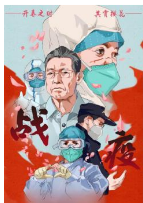
《 “ ” 言 》