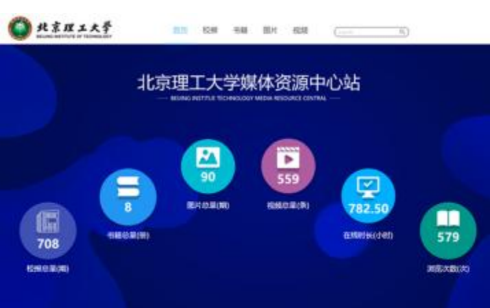
北京理工大学媒体资源中心站 2019年12月15日 正式上线

l , ZU C > ( ' : % C 1940 ( : v ] y < l 4 . 6n . y , 7' : . 6n , / _ ' U6n > ' : 5 Y , Y , m 3 Y , 7' : " % , 6n > ' : l " 7 " . 2019 ( , ? > ef < l q w, OB R ( ' : " 5 * l " 6n4 > xw, ef Z i } # & # . , AB / _ m q 4 % x Z , dE C > " # $ % &' < l 7g " 6n , 6 > : < l 4 w * E, # . " : * u # " 8 < l . 3 & * 4 " " # $ % &' < l 7g " , B : n l 708 ! , < > x : 1955 ( : n v ] 49 - G l , 90 ! . * E & l , 559 : 5 3 } 8U9 :