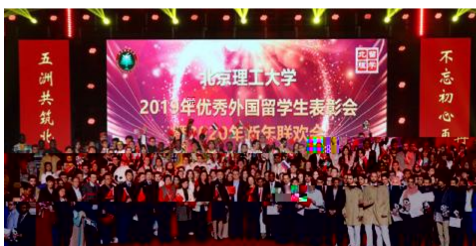
北京理工大学 2019年优秀外国留学生表彰会暨2020年新年联欢会

- ' ? * D & 3 EF . GH ) : . l ? @ , J , ^ K ) . L . < M > ~ . , N + _ O . L . * E } ? . l Z K P Q R F , ) * . l ST | VUVa & , . l * W ? @ X > PAJ k , ] L 7 xYZ > V f S [ 4 . = > m \ ] y , ^ o ^ R , f S Co ] ^ - ' . d = , U $ , ef 4 ] _ y , ab ? @ ) U $ O ^ K j k , c J de . ] ( B / f - 260 gh , Ji . 6 j ! ky l B / S Cl f - 2.4h . Og mn op, q & # K " r & s k O , " s k t " ] L + , y u v w * x r / = s * ? & r , " $ , 7 ' y ^ k z 5 Cx , 6 y & { E & | } B 1 . Um & 1 v " ~ . , c " $ e , ^ g D " ? " , Q ? " , ) , 8 , de , 9 " - $ h , Q ? " C 50 g $ , Y 4 150 g ( , 7 ' y - G > * / , 7 } B . f V } q V 4 5 6 7 8 , 6 f 4 " $ % : 7 > , c " $ e " 4 o O } O . , 3 . 2019 ( 4 " - ' " $ , + = ) * , 7 ' y 8 de 4 , # > ' y 365 ! l 4 ; e , ) - * N ) . " $ 4 , C > 7 + . - . bl c 4 B 4 . ~ . , c " $ e , ^ g D , 2020 ( " - ' " $ " DRB , o 3 , v ) BCD 80 ( : G ! (文/留学生中心 赖侠)