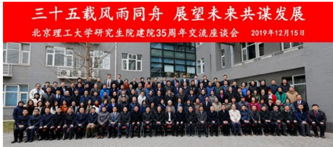
三十五载风雨同舟 展望未来共谋发展 北京理工大学研究生院建院35周年交流座谈会 2019年12月15日

" # &' de. H F l l $ / 7, d e. F4 1w' # &' de. " $ % de. 6 35 ( / v 祝 * , $ / 7, ' i % de. d= ' 1) b^&' de. ( x: de. d=& [ @A4显著 C / v 祝 * . \ U] $ / , f ' i 办, d= ' i U $ % de. d=s ( " $ % de. 6 35 ( w & [ @A4C / v 热 4祝 * . z / v, " $ % de. ( x, ' i % de. d= % x z R > GI FG. zOW, ] de. d=如何B4_临 3z5) 3<遇, de. d=l; < B4, _ : E拥q &4C' 权, ^K de. d=B4 W ,促oCdd=B4f $ .